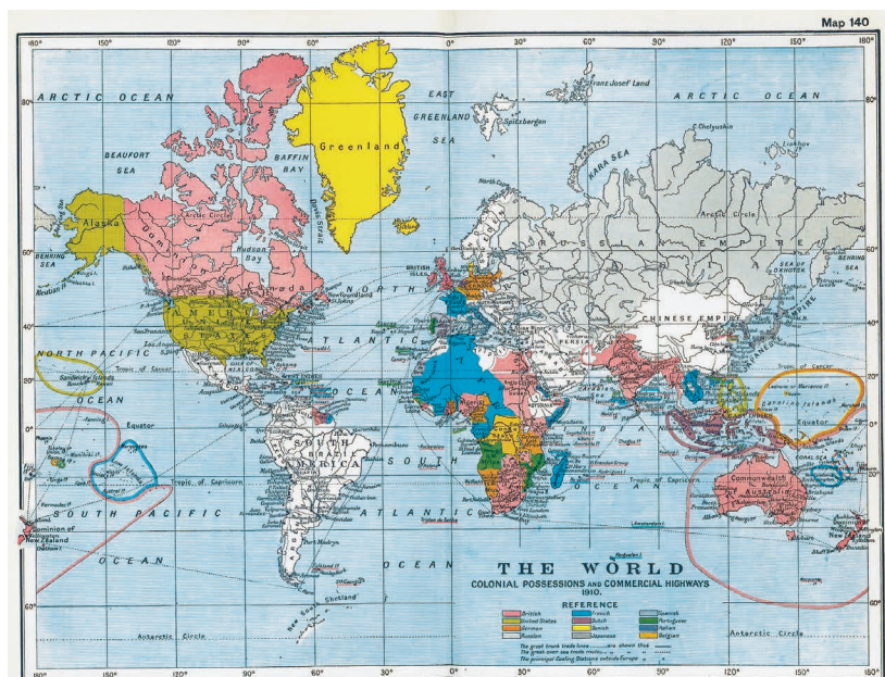
Карта колониальных владений в 1910 г. 3

индейского населения Америки, торговля рабами-африканцами, голод в Индии, опиумные войны в Китае – известные вехи в истории колониализма. Колониальные империи соперничали друг с другом в борьбе за мировую гегемонию. Незападный мир оказался поделен между ними на колонии и сферы влияния. Наполеон в XIX и Гитлер в XX столетии попытались реализовать проекты мирового господства. Миллионы жертв были положены на чашу весов ради концентрации финансовой власти в руках глобального олигархата. И нет никаких оснований сомневаться, что для достижения тотального господства он не пойдет на новые жертвы тех, кто не относится к категории избранных.