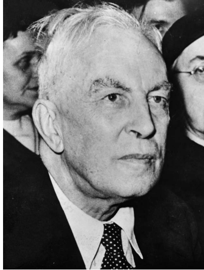
Арнольд Джозеф Тойнби (1889–1975) 29