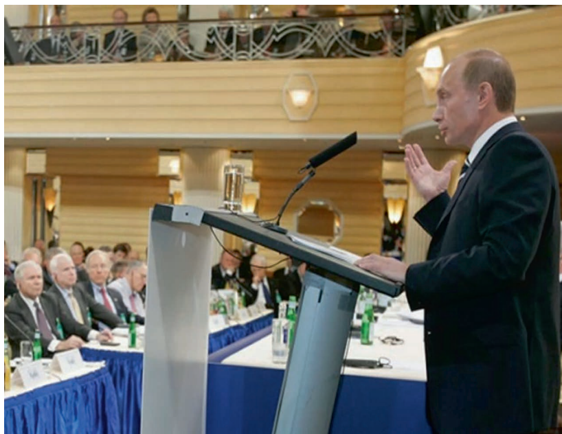
Выступление В. В. Путина в Мюнхене, 2007 г. 15

президент России В. В. Путин. Кризис однополярности проявляется не только в утрате Западом экономического лидерства. Модернизация вооруженных сил России и Китая изменила соотношение сил в военно-технической сфере и поколебала представление о приоритете военной мощи Запада.